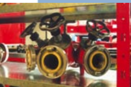
Magazijn Brandweer Alkmaar, veelzijdig!

Magazijnruimte is kostbaar. Efficiëntie per meter 3 is het credo. Belangrijk is dan een functionele opslag waar ook nog eens economisch gewerkt kan worden. Voor deze eisen is het GS-3-legbordsysteem uw juiste keus. Een volledig Nederlands kwaliteitsproduct dat wordt gefabriceerd volgens de strenge ISO-9002:2000 norm. De stijlen,